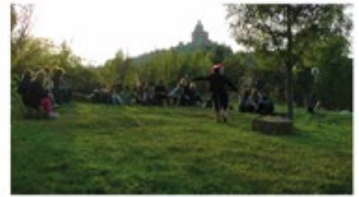
Parco San Pellegrino