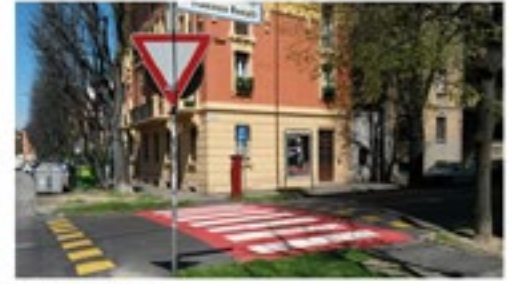
Zona 30 Turati